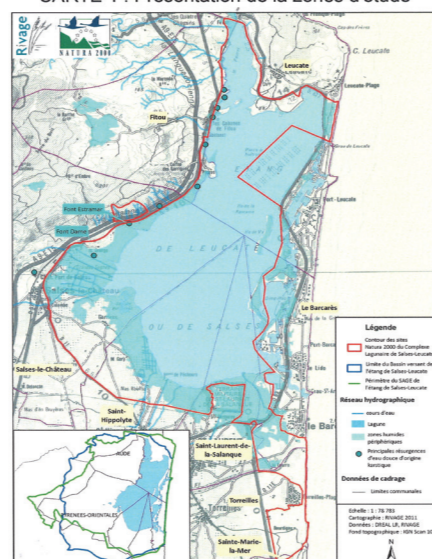
CARTE 1 : Présentation de la zones d'étude

« habitats, faune, flore » ont permis la mise en place du réseau Natura 2000. Les représentants Natura 2000 ont collaboré, avec les élus locaux, les agents du Conservatoire du littoral et les différents acteurs de Perpignan Méditerranée Communauté d'Agglomération, Life Nature, chasseurs et agriculteurs, services de l'Etat, à l'élaboration du plan de gestion du Bourdigou. ■